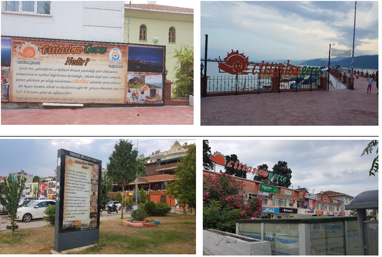
Tablo 1. İlçedeki cittaslow amblemlerinden örnekler

İlçe sakin bir balıkçı kasabasıdır; cuma günleri köylülerin doğal olarak yetiştirdiği tarım ürünlerini Gerze halkına ve misafirlere sunduğu Üretici Pazarı kurulmakta, yöresel yiyeceklerin sunulduğu mekanlar sahil boyu yer almakta, bunun yanı sıra ahşap oyuncak, model gemi, çini ve peşkir atölyeleri ve satış birimleri bulunmaktadır.