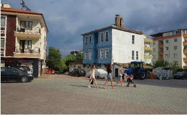
Tablo 2. Gerze açık mekan kullanım örnekleri