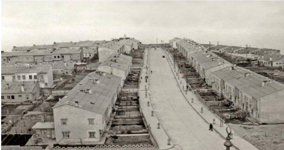
Şekil 2. Gerze yangın evleri (1960) (URL3)